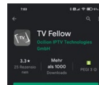
Google Play Store (Android)