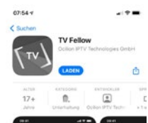
Apple App Store (iOS)